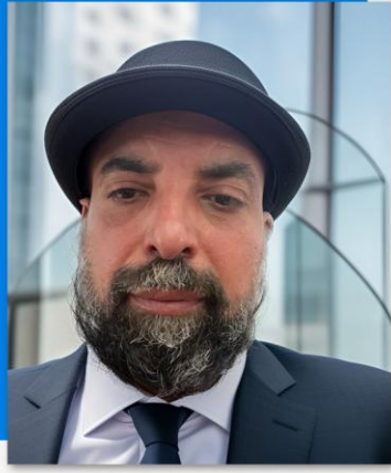
أ. د/ محمد خير الوزير

رئيس أكاديمية جنيف للعلوم القانونية والدبلوماسية - إعادة الانطلاق الإنساني (GADDS) المركز الدولي جون نوكس - لو غران ساكونيه - جنيف - سويسرا